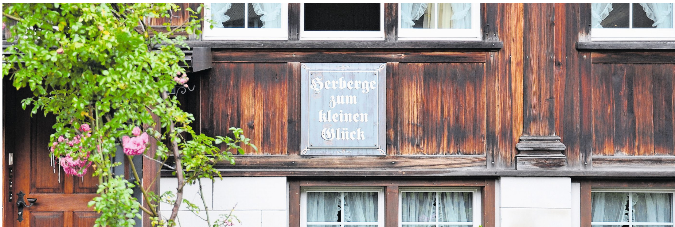
Ferien in der Herberge zum kleinen Glück sind beliebt.